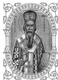
Св. Владика Николај